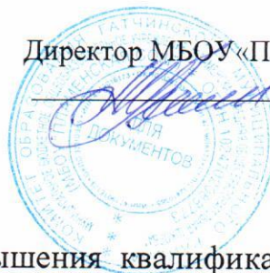
График прохождения курсов повышения квалификации педагогическими работниками